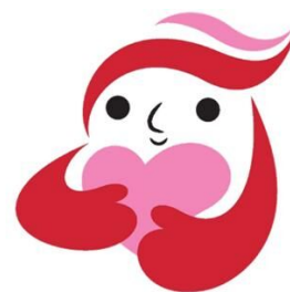
犯罪被害者等支援 シンボルマーク 「ギュっとちゃん」